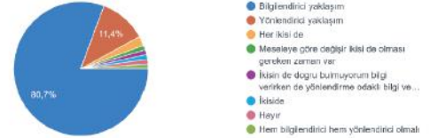
Siyasi liderlerin sosyal medyayı; vatandaşları bilgilendirici biçimde kullanmalarını mı yoksa vatandaşları yönlendirici biçimde kullanmalarını mı doğru ve etkili buluyorsunuz? 88 yanıt

Eskiden olduğu gibi siyasilerin bir düşünceyi, fikri ya da eylemi olumlayarak gençlere empoze etmeye yönelik paylaşımları veya yaklaşımları günümüz gençlerinin pek de hoşlanmadıkları ve makul bulmadıkları bir tutum. Daha önce de bahsettiğimiz gibi bunun sebepleri; bilgiye ulaşmadaki kolaylık, küreselleşen dünya ile ortaya konan meselelerin emsalleriyle arasında kıyas yapabilmeye imkanı, siyasal yönetişimin ortaya çıkması ve tabii ki teknolojinin getirdiği değişim ve dönüşümlerdir. Dolayısıyla gençler, siyasilerin yaptıkları paylaşımlarla kendilerine ait bir doğruyu empoze etme girişimlerinden ziyade; yapılan işin hakikatini anlatmaya yönelik paylaşımlarını makul ve etkili bulunmaktadır. Nitekim bu çıkarımlara da yine gençlerin verdiği yanıtlardan ulaşıyoruz;